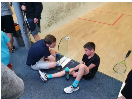
I na emoce došlo 😊