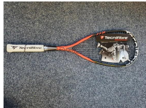
Nezapomeňte do 10.00 natipovat. Hrajeme o raketu Tecnifibre Dynergy 117